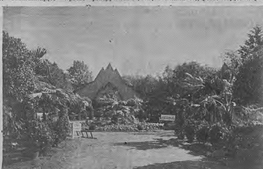
Widok ogólny na teren Wystawy Ogrodniczej w Łodzi.