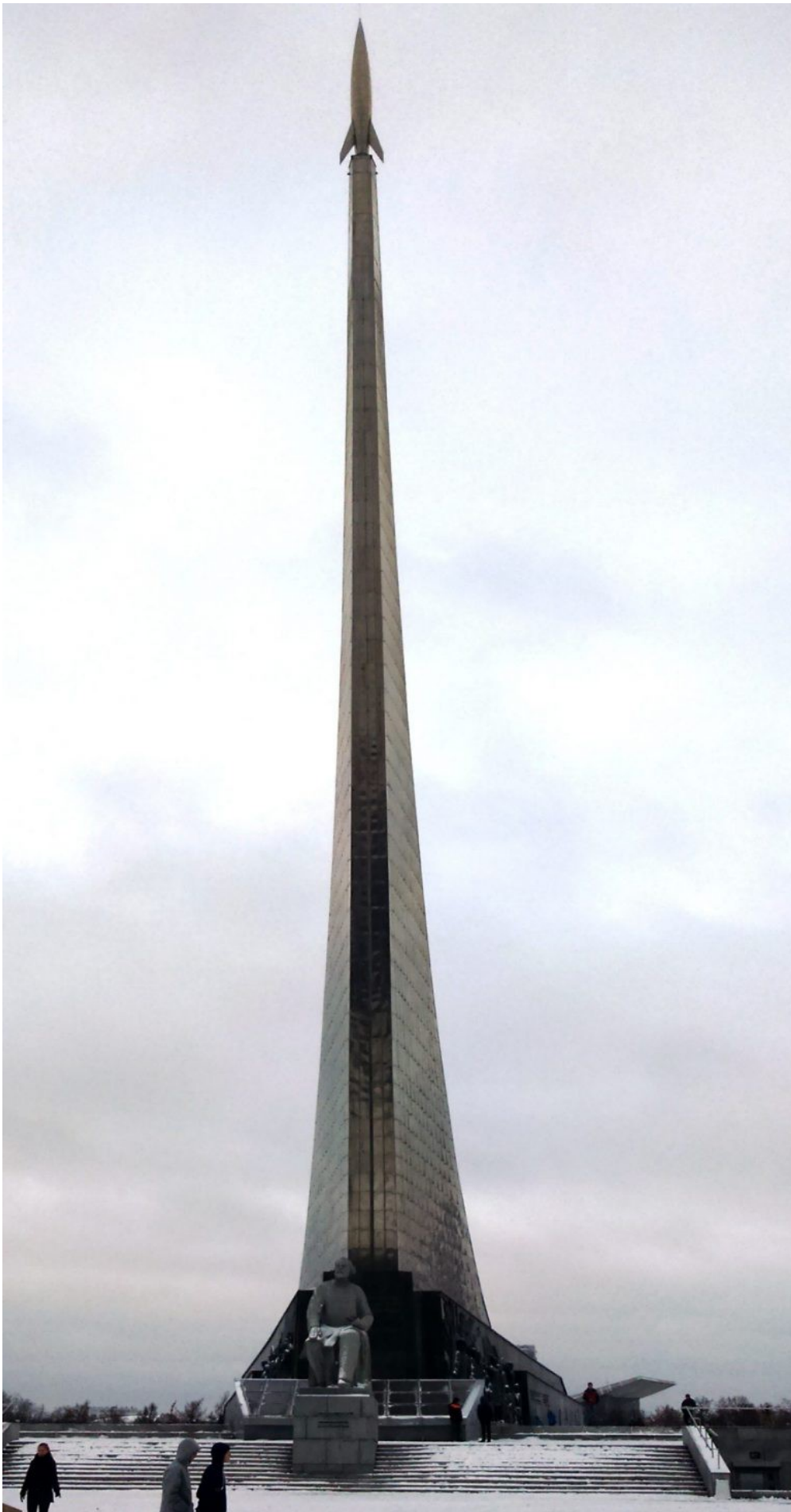
Powyżej Pomnik Zdobywców Kosmosu